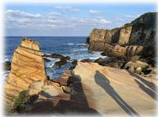
台 2 公路鼻頭角近處南雅奇石地質地貌

儒家有：「仁者樂山，智者樂水」。這裡沒有等序，暫依山、水或兩者兼具來推薦：一；由台 14 甲支線即由霧社跨越合歡山武嶺經大禹嶺，接台 8 往天祥進太魯閣國家公園，出立霧溪轉台 9 北上蘇花公路崇德段，是太魯閣國公園以峽谷海岸斷崖著稱，也是台灣地質景觀之最。二；台 11