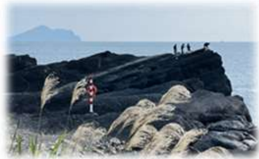
台 2 公路 眺望釣客與龜山島

台灣最美的公路推薦：美，沒有一個標準，在觸目入情的感發中，在四季隨天候的變化裡，在自己心情興致或酸甜苦辣懷舊的同時，或一段親身經歷的美好，與不怎愉快烙印的回憶中，無須仇恨，順逆皆是成長的因緣……。近代文學教育兼畫家豐子愷提到：「漸」把時間帶向一個使人生圓滑進行的微妙的要素；造物主騙人的手段，也莫如「漸」。無時不有生的意趣與價值，於是人生就被確實肯定，而圓滑地進行了。」個人利用剛退休的前後，自駕再走台灣幾條覺得地形、地質、地貌，還有景觀在四季輪替過程中的自然現象。我(們)用自身「眼、耳、鼻、舌、身、意(腦)」等成為「感知投注」的美景，與諸君共賞。