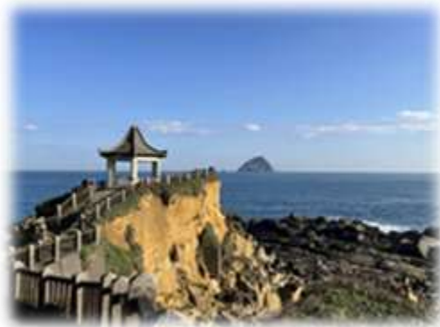
和平島地質公園無上妙亭望 基隆嶼

個人永遠記得母親生前提過三件事假不了：一是沒有力氣使不了(譬如搬東西)、二是沒有金錢假不了(譬如少一塊錢無法買到要去地點的車票)、三是沒有知識裝不了(譬如基本的理化或地球科學的常識)。每一個人的旅遊或散心的方式未必一樣，上提只是我們台灣人的一項個人所走過的條列