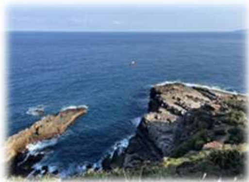
台2公路龍洞灣岬遠眺右 上三貂角

參考與推薦閱讀：《地景》-東部海岸國家風景區遊憩解說叢書(1999年/可能絕版)